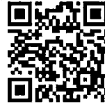
綠色辦公響應完成 確認電子表單

如對綠色辦公響應操作上仍有疑問請登入 全民綠生活資訊平台 參閱綠色辦公響應操作說明，如需人員服務諮詢專線如下並歡迎使用諮詢信箱，並留下您的電話，以利進一步提供詳盡說明。